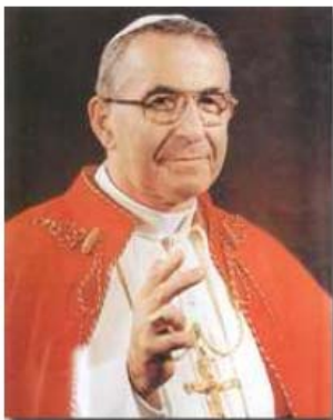
Papa Giovanni Paolo I

Giovanni Paolo I (Papa Lucani) era solito da cardinale trascorrere qui le vacanze estive e Papa Giovanni Paolo II fece visita alla Madonna di Pietralba il 17 luglio 1988.